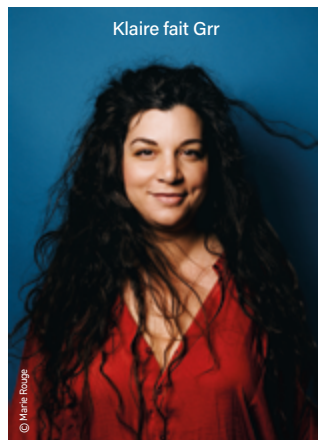
Klaire fait Grr