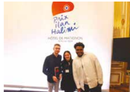
3 membres de la Mission locale Limoges Métropole : lauréats du Prix Ilan Halimi 2024

Prix Ilan Halimi : Radio France accompagne le prix Ilan Halimi pour lutter contre le racisme et l'antisémitisme. Créé par la Délégation Interministérielle à la Lutte Contre le Racisme, l'Antisémitisme et la Haine anti-LGBT (DILCRAH), ce prix récompense un travail collectif mobilisant au moins 5 jeunes âgés de moins de 25 ans ayant mené une action visant à lutter contre les préjugés et les stéréotypes racistes et antisémites.