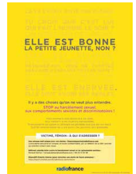
Campagne d'affichage interne, à Paris et en région, pour dire « STOP au harcèlement sexuel et aux comportements sexistes et discriminatoires à Radio France », reprenant des témoignages réels de salariés recueillis dans le cadre des enquêtes réalisées à Radio France. Ces verbatims anonymisés exemplifient en peu de mots la gravité et le caractère déshumanisant de propos qui ont été tenus et sont tenus au sein de la maison.