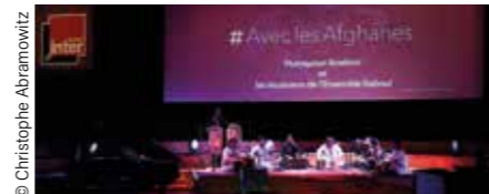
5 octobre 2021 : France Inter consacre une soirée spéciale aux femmes afghanes.

Radio France continue de renforcer sa production de programmes et de journées spéciales favorisant la part des femmes à l'antenne ou sensibilisant ses auditeurs et auditrices au sujet de l'égalité. Les journées du Haut Commissariat à l'Égalité (HCE), la journée internationale des droits des femmes, les événements de soutien aux femmes iraniennes et afghanes (France Inter) ou à l'opération Sport au féminin lancée par l'Arcom ont été autant d'occasions de témoigner de l'engagement continu de Radio France pour l'égalité des genres sur l'ensemble de ses antennes.