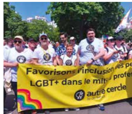
Marche des Fiertés 2023 avec l'association L'Autre Cercle