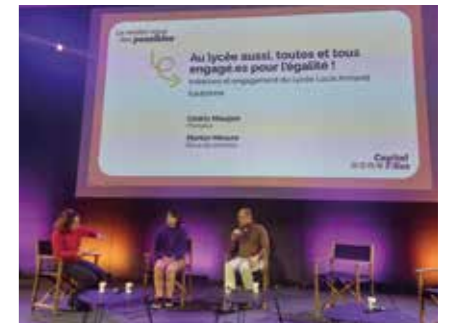
Salhia Brakhlia, journaliste politique et animatrice de la matinale de franceinfo, anime le forum annuel Capital filles (mars 2024).

Tout au long de l'année, Radio France engage des actions avec ses salariés et ses partenaires associatifs comme Capital Filles pour promouvoir l'égalité entre les sexes sur ses antennes et en interne. À travers des rencontres métiers autour du numérique, la mise en avant de personnalités féminines et rôles modèles inspirants, la promotion des parcours féminins, la sensibilisation en lycées et collèges, Radio France œuvre pour ouvrir le champ des possibles à toutes.