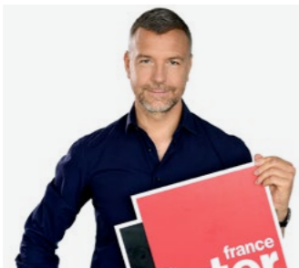
LA TERRE AU CARRÉ MATHIEU VIDARD Du lundi au vendredi 13h30 à 14h30

Saison historique pour le 7/9 de Nicolas Demorand et Léa Salamé avec plus de 4 millions d'auditeurs au quotidien. Un record absolu pour cette tranche qui pour la 16 e fois consécutive remporte la première place et sacre Florence Paracuellos la voix la plus écoutée de France avec les 2 241 000 auditeurs du journal de 8h. L'éclectisme de la programmation, la qualité des journaux, la pertinence des éditorialistes, le temps long offert aux invités, la musique et l'humour en font un rendez-vous d'actualité unique et indispensable.