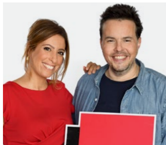
LE 7/9 NICOLAS DEMORAND ET LÉA SALAMÉ Du lundi au vendredi 7h à 9h

Saison historique pour le 7/9 de Nicolas Demorand et Léa Salamé avec plus de 4 millions d'auditeurs au quotidien. Un record absolu pour cette tranche qui pour la 16 e fois consécutive remporte la première place et sacre Florence Paracuellos la voix la plus écoutée de France avec les 2 241 000 auditeurs du journal de 8h. L'éclectisme de la programmation, la qualité des journaux, la pertinence des éditorialistes, le temps long offert aux invités, la musique et l'humour en font un rendez-vous d'actualité unique et indispensable.