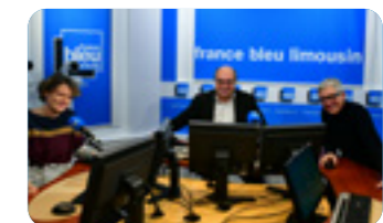
VDEF - studio FB Limousin

La vie en région, c'est bien sûr aussi l'économie locale avec la Tournée des Marchés que nos 44 stations locales organisent chaque année sur tout le territoire. Un événement qui vise à promouvoir les producteurs, les artisans, les métiers de bouche et les circuits courts de chaque région de France. Les deux prochaines tournées auront lieu en septembre/octobre et février/mars 2023.