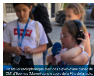
Un atelier radiophonique avec des élèves d'une classe de CMI d'Épernay (Marne) dans le cadre de la Fête de la radio.