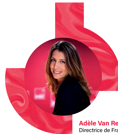
Adèle Van Reeth Directrice de France Inter

(3) Médiamétrie eStat Podcasts (France Inter 1 re radio tous les mois depuis le lancement de la mesure)