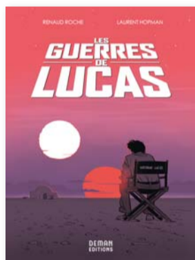
Les guerres de Lucas Laurent Hopman, Renaud Roche