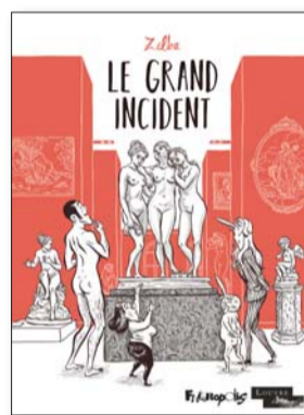
Le grand incident Zelba