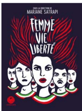
Femme, Vie, Liberté Collectif dirigé par Marjane Satrapi