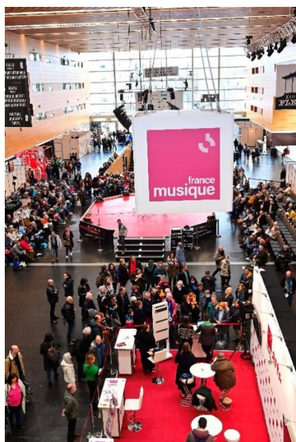
La Folle Journée 2023

France Musique est de retour à la Folle Journée de Nantes du 2 au 4 février pour le plus grand bonheur du public nantais et des auditeurs qui pourront assister aux émissions dans le Studio France Musique et aux animations (dédicaces, rencontres...) au cœur de la Cité des Congrès.